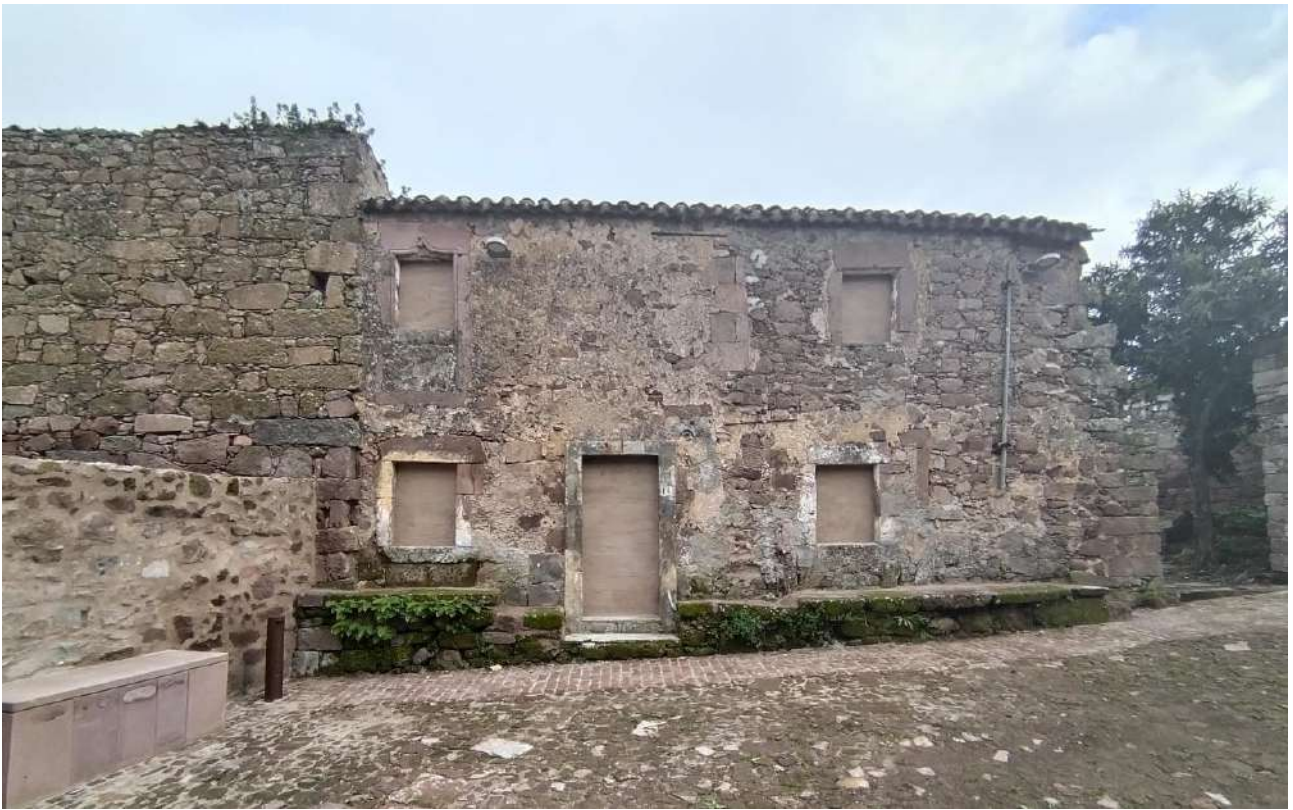
01 [ corpo A ]