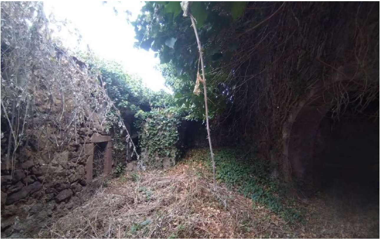
05 [ corpo A ]