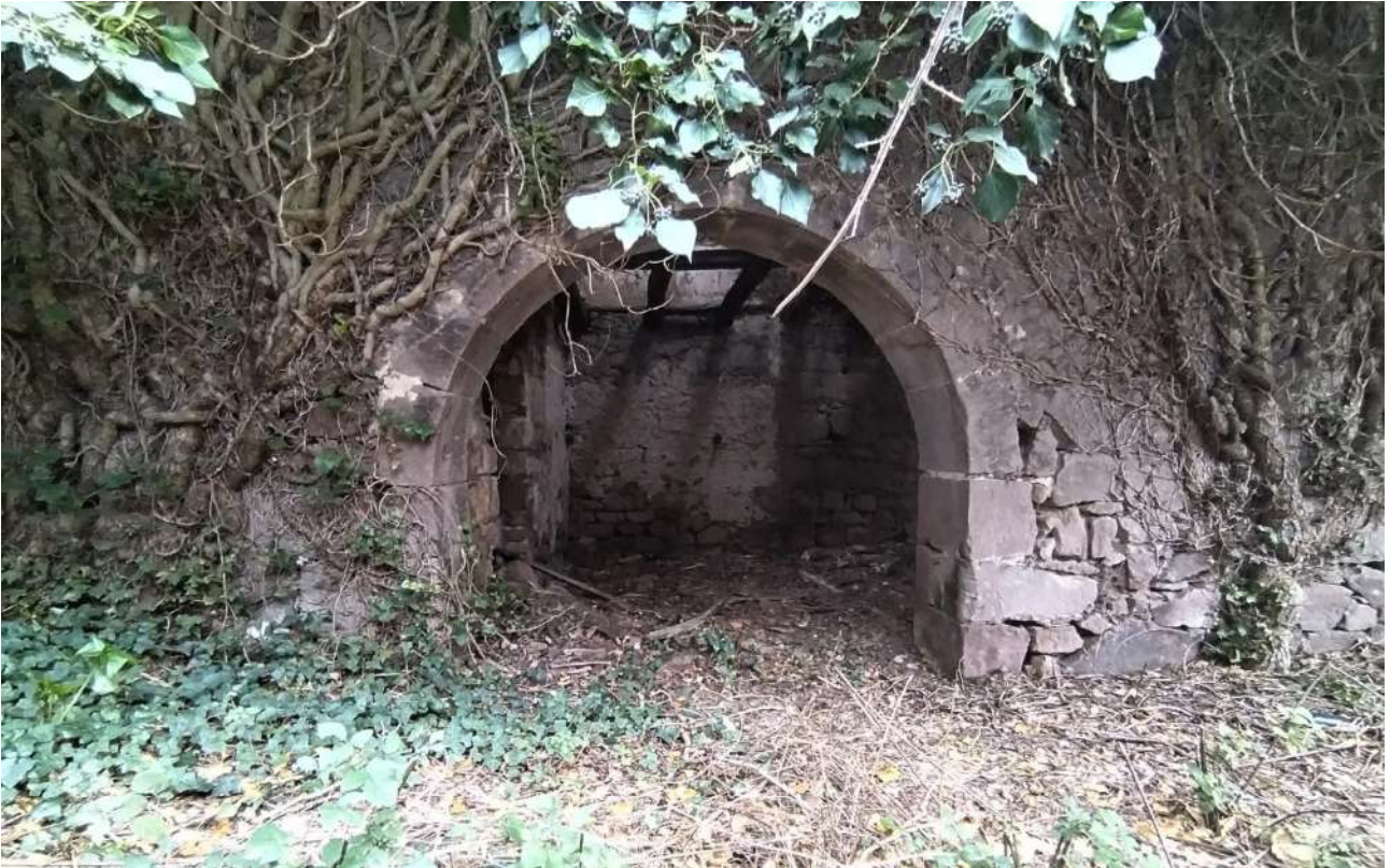
08 [ corpo B ]