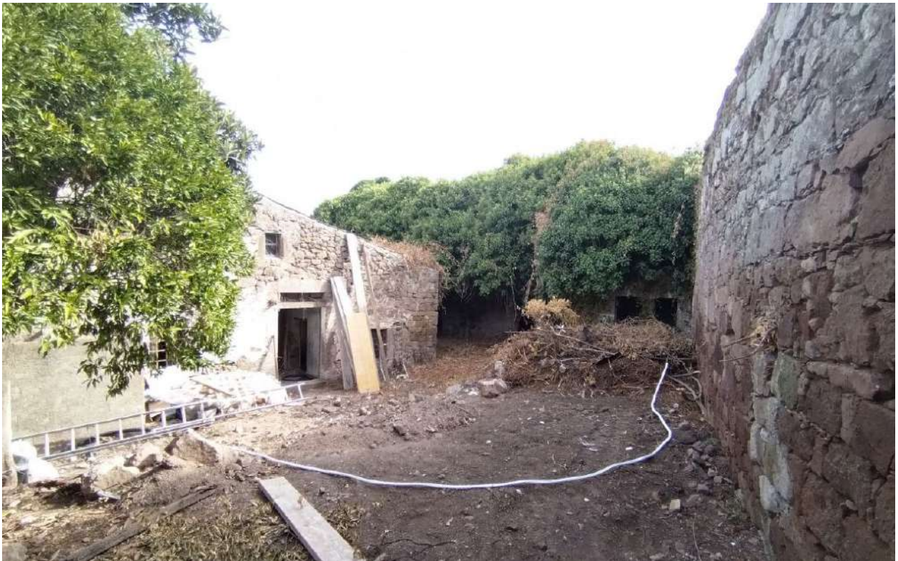
06 [ corpo A - corpo B ]