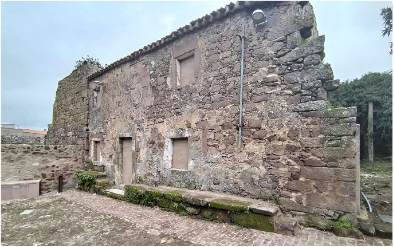
02 [ corpo A ]