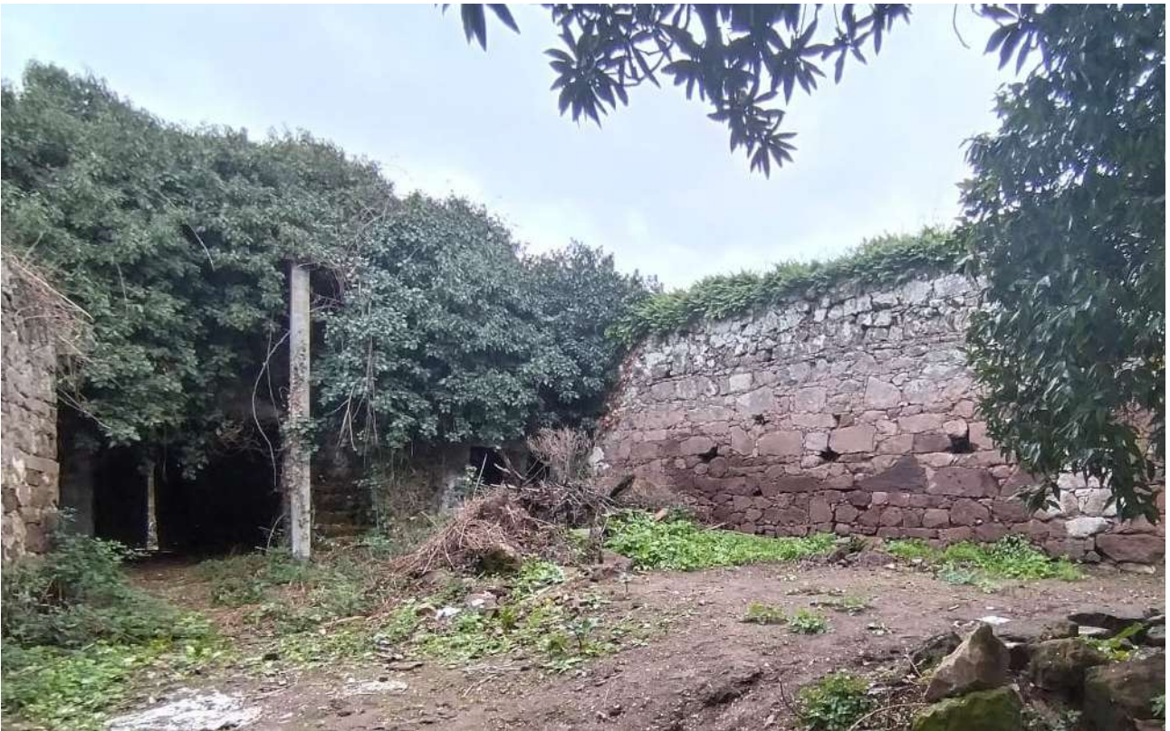
07 [ corpo B ]