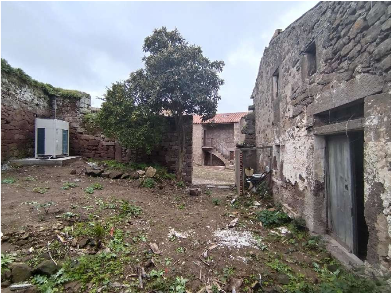
04 [ corpo A ]