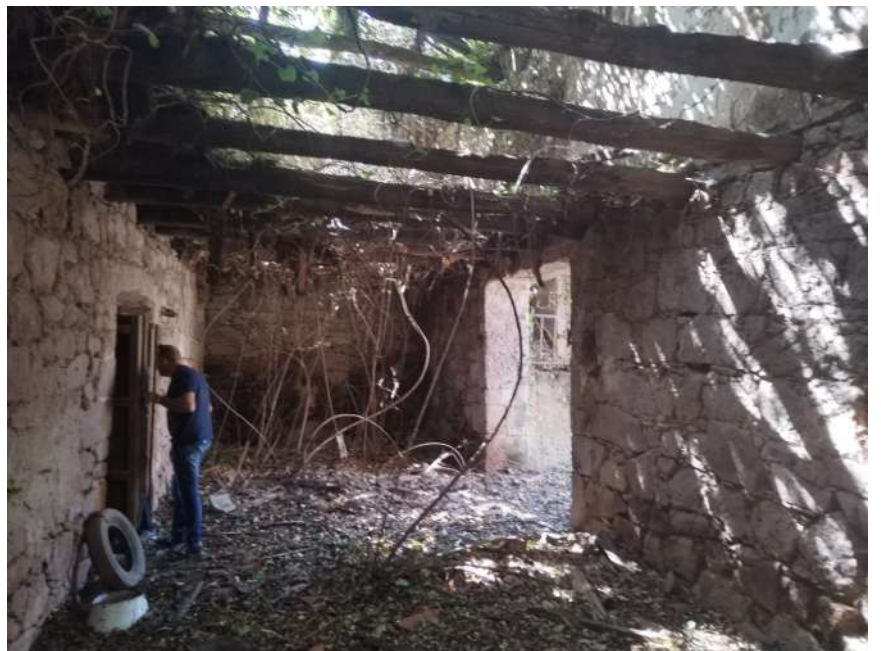
viste interne corpo B