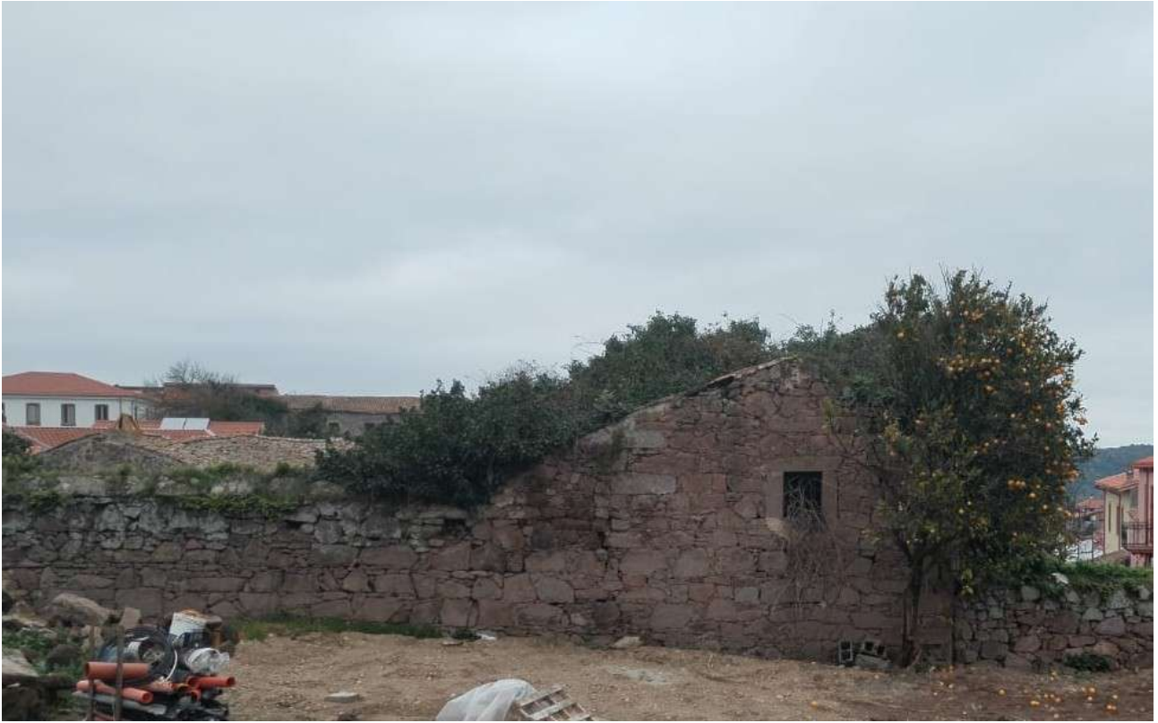
10 [ corpo B ]