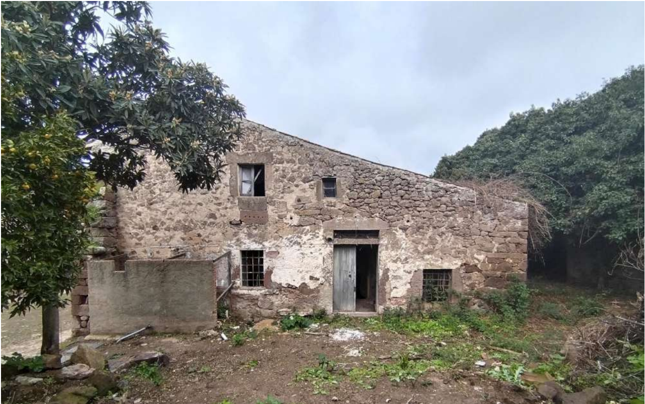
03 [ corpo A ]