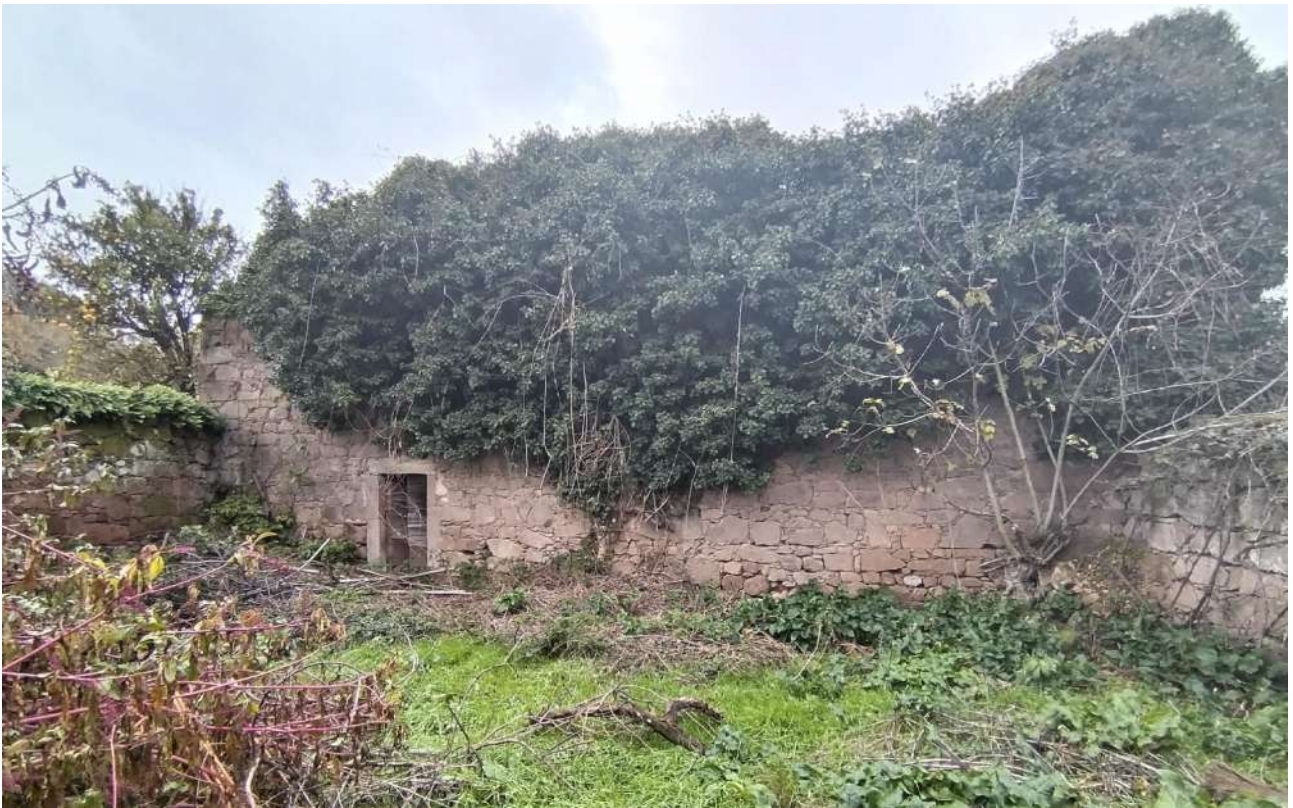
09 [ corpo B ]