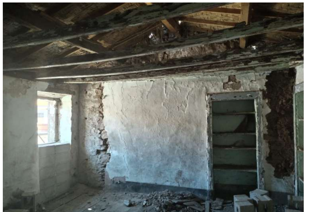
viste interne corpo A