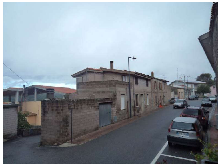
FOTO VIA ROMA