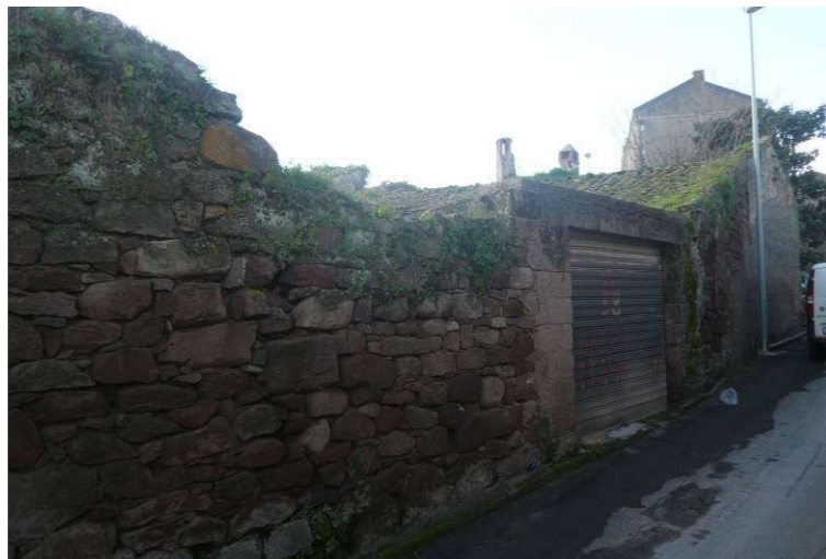
FOTO SU VIA SATTA E SU VIA DEI GIUDICATI